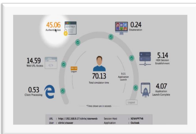
Abb. 2: Transparenz für Login-Prozesse und lokalisieren der Ursache für langsame Anmeldevorgänge